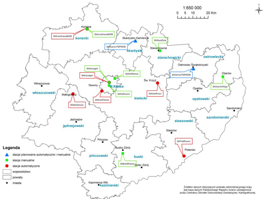
Mapa 3.1.1.b. Lokalizacje stacji monitoringu jakości powietrza działających w ramach PMŚ w woj. świętokrzyskim w latach 2018-2020

4. Na stronie 19 Programu , zmienionego Aneksami nr 1 i nr 3 do Programu , Mapę 3.1.1.b. zastępuje się następującą mapą: